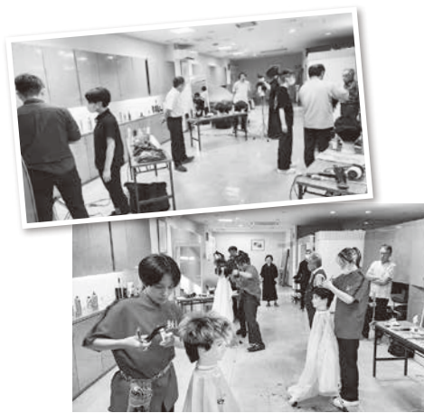
強化練習会の様子