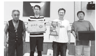
団体2位 秋田北支部